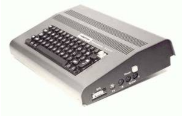
Prototyp 01/83 „Shafy“