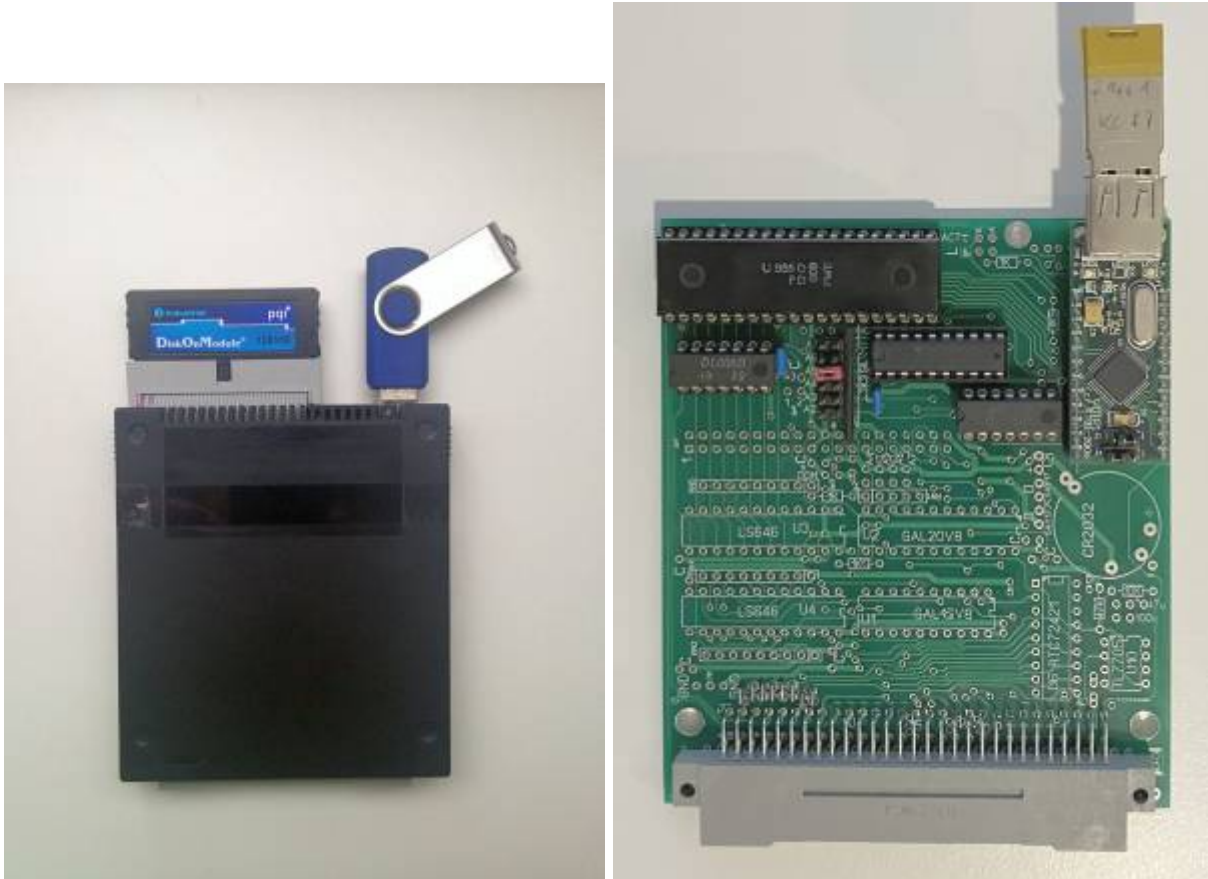
GUR-V3-Modul, und Teilbestückung nur USB

An das VDIP1-Modul wird ein USB-Stick angesteckt. Unterstützt werden USB 1.1 und USB 2.0-Sticks. Ein 8GB-Stick wurde erfolgreich getestet. Der Stick muss mit FAT12, FAT16 oder FAT32 formatiert sein. Ein V2DIP-Modul unterstützt normalerweise nur FAT 16 und FAT32.