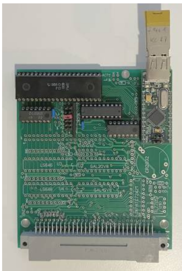
GUR-V3-Modul, und Teilbestückung nur USB

An das VDIP1-Modul wird ein USB-Stick angesteckt. Unterstützt werden USB 1.1 und USB 2.0-Sticks. Ein 8GB-Stick wurde erfolgreich getestet. Der Stick muss mit FAT12, FAT16 oder FAT32 formatiert