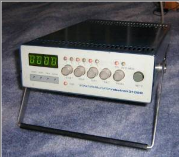
Signaturanalysator robotron 31020 (ohne Tastköpfe)

Ein Signaturanalysator analysiert ein digitales Signal, indem über einen definierten Zeitraum über das Signal eine CRC-Summe (= Signatur) berechnet wird. Anfang und Ende des Zeitraums werden dem Gerät über zwei Eingänge signalisiert. Stimmt die angezeigte CRC mit der im Signaturplan hinterlegten überein, ist mit hoher Wahrscheinlichkeit die Leitung in Ordnung. Beim Z9001 gibt es spezielle Service-Testprogramme (1 bis 12), die definierte reproduzierbare Signale auf den einzelnen zu testenden Signalleitungen produzieren. Die zugehörigen CRC stehen in der Reparaturanleitung.