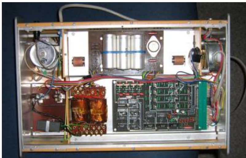
Innenleben des XY4130.