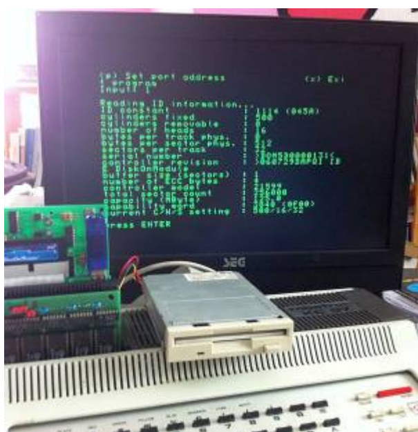
Start von GIDEC.COM, Menüpunkt 1 (Info)