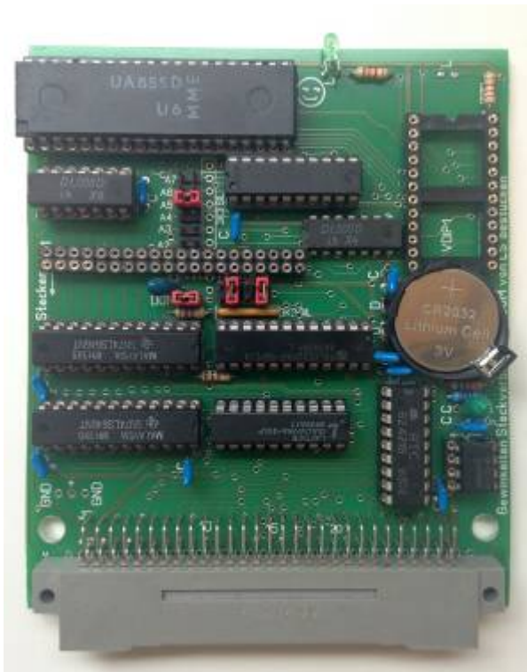
v.l.n.r.voll bestücktes Modul, geöffnetes Modul, Leiterplatte, bestückte Leiterplatte