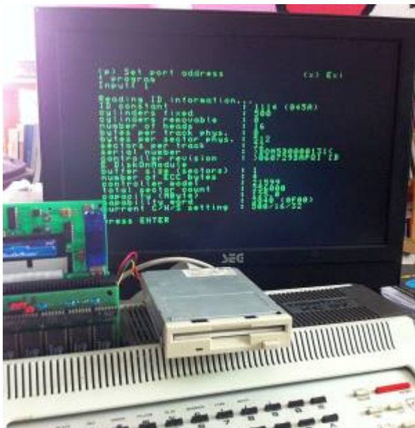
Start von GIDEC.COM, Menüpunkt 1 (Info)