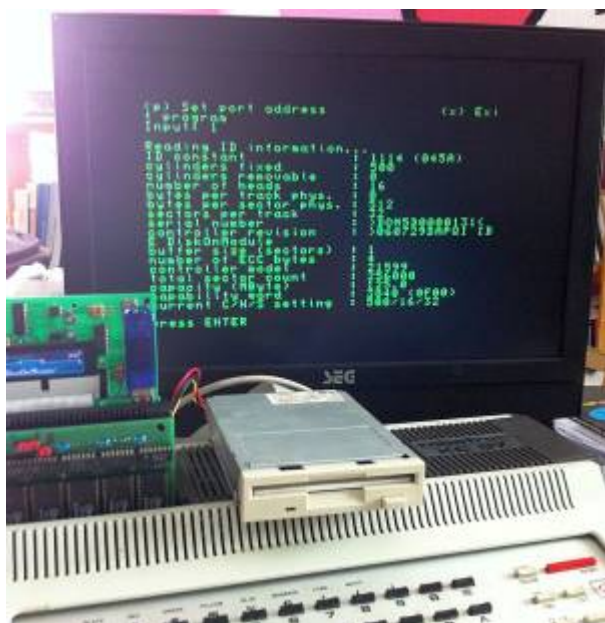
Start von GIDEC.COM, Menüpunkt 1 (Info)