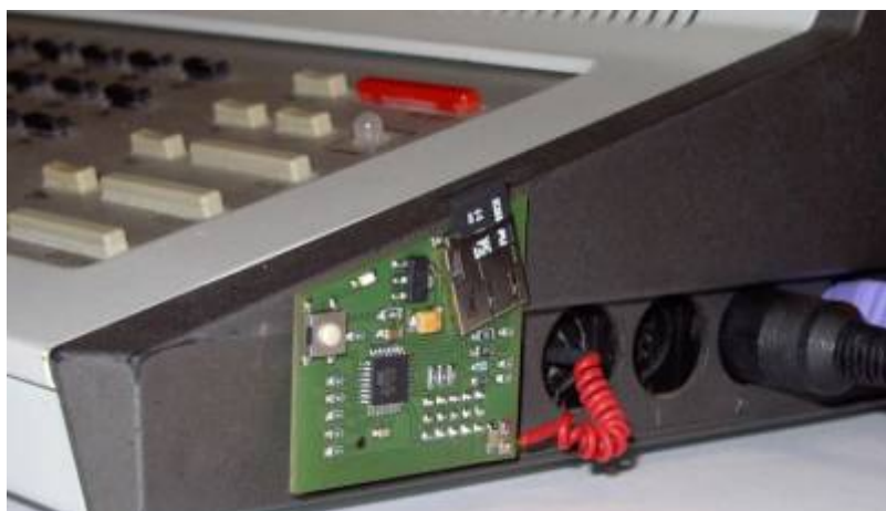
neue Version mit Micro-SD-Card und ATmega328p

Von Kingstener habe ich ein fertig aufgebautes SD-CARD-Interface für die KC's bekommen. Zur Nutzung am Z9001 kann man das noch abspecken, benötigt wird i.W. nur ein Mikrocontroller ATMEGA32 und eine SD-CARD-Fassung (s. neue Variante im Bild). Die Hardware wird am User-Port und anstelle des Kassettenrecorders am Tape-Eingang angeschlossen und fungiert als digitaler Kassettenrecorder. Am Z9001 muss nichts verändert werden! Nach RESET wird automatisch ein kleines Monitorprogramm an den Tape-Eingang gesendet, was auf dem Z9001 gestartet wird und die weitere Kommunikation mit der SD-Karte über den USER-Port übernimmt. Das ganze ist wirklich recht schnell und funktioniert sehr gut!