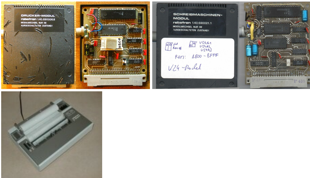
(v.l.n.r: Modul 690006.8, Modul 690021.1, K6304)

Tip: Die komischen Rillen auf dem Gehäuse (erstes Bild) stammen von den Weichmachern im Kabel. Deshalb sollten die Original-Kabel ersetzt werden oder in der Sammlung immer in eine extra Plastetüte gesteckt werden.