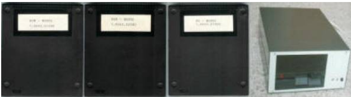
Diskettenstation: CP/M-Module incl. Diskettenbeistellgerät

Die originale Variante des ZfK Rossendorf und deren Weiterentwicklung von Robotron benötigt 3 spezielle Module: