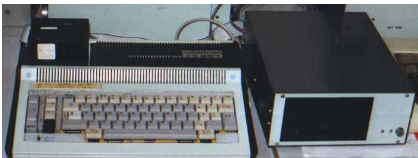
KC87 mit Eigenbautastatur und Robotron-Diskettenbeistellung. Besitzer http://www.inf.tu-dresden.de/~ss17 .

Als professionelle Varianten für den Betrieb von CP/M am Z9001 gibt es mindestens zwei Lösungen: zum einen die drei Rossendorfer Module und zum anderen die drei Module von Robotron. Die Robotron-Variante basiert auf den Entwicklungen aus Rossendorf.