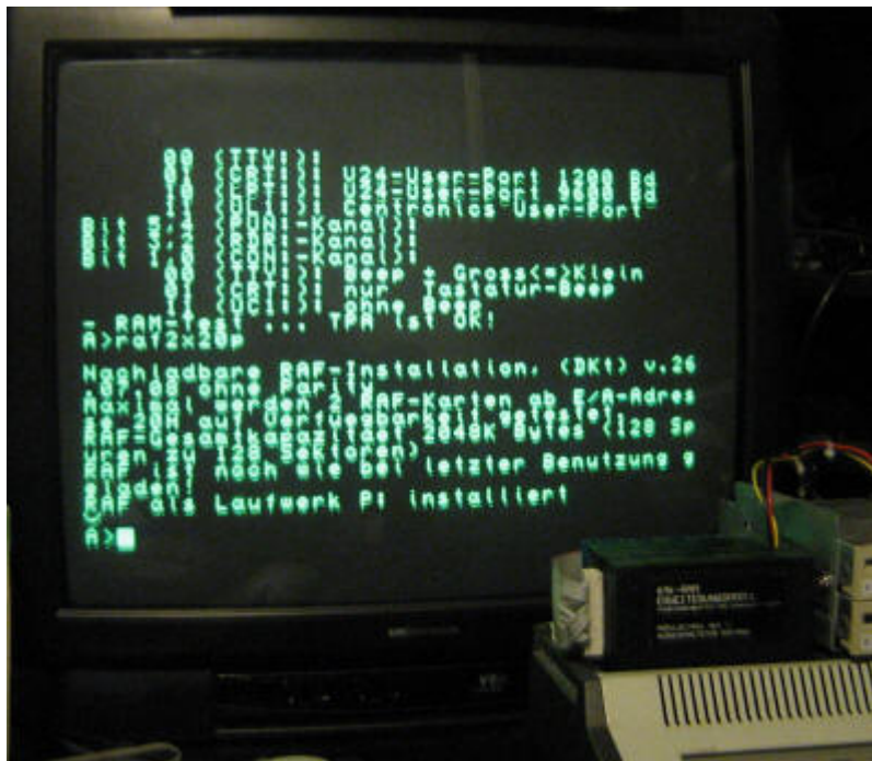
Meine RAF2008, mit 2MByte SRAM bestückt. Rechts ist der CP/M-Start und der Start des nachladbaren Treibers RAF2X20P.COM zu sehen.