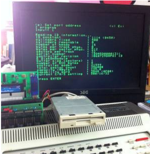
Start von GIDEC.COM, Menüpunkt 1 (Info)

Das Modul von Bübchen lief auf Anhieb, nachdem der GAL ST 20AS25HB1 gegen einen PALCE20V8H ausgetauscht wurde. Entweder macht mein Brenner Probleme beim ST-GAL oder dieser GAL-Typ funktioniert generell nicht besonders gut?