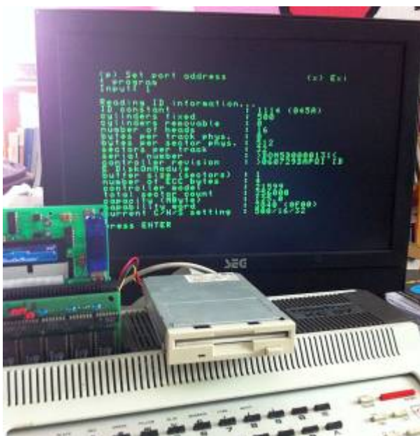
Start von GIDEC.COM, Menüpunkt 1 (Info)