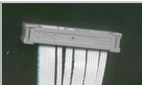
Modul von hinten, (auf dem Kopf stehend!)