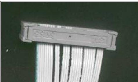
Modul von hinten, (auf dem Kopf stehend!)