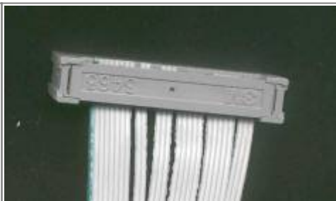
Modul von hinten, (auf dem Kopf stehend!)