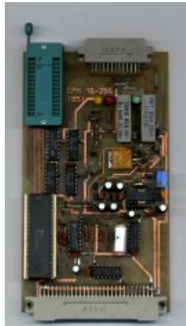
EPROMMER 2.9/IGD , EPROMMER 2.9/CCL