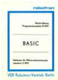
Beschreibung Programmkassette M 0111 BASIC

From: https://hc-ddr.hucki.net/wiki/ - Homecomputer DDR