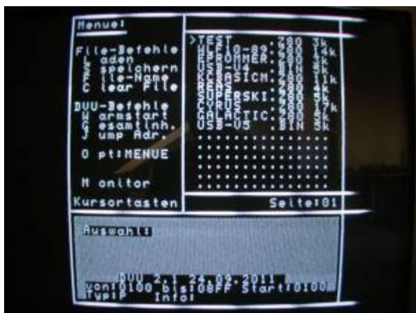
Bildschirmmenü des DVU 2.1

Für den Betrieb dieses USB-Modules stehen zwei Softwarevarianten zur Verfügung. Zum einen das DVU [Z1013-DVU2_V10_A000-B2A4_DC.BIN]; lauffähig im RAM auf Adresse A000-B2A4h (Initialisierung: J A000 und Start mit @U). Wie gewohnt gibt es hier eine Menüführung zu allen Funktionen der Software.