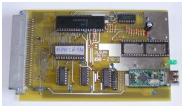
Prototyp mit VDIP1 und dem Zusatzmonitor MONER-SU inklusive Sprungverteiler

Für den Betrieb dieses USB-Modules stehen zwei Softwarevarianten zur Verfügung. Zum einen das DVU [Z1013-DVU2_V10_A000-B2A4_DC.BIN]; lauffähig im RAM auf Adresse A000-B2A4h (Initialisierung: J A000 und Start mit @U). Wie gewohnt gibt es hier eine Menüführung zu allen Funktionen der Software.