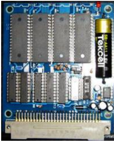
K1520-I/O Platine mit zwei Port-Adressen