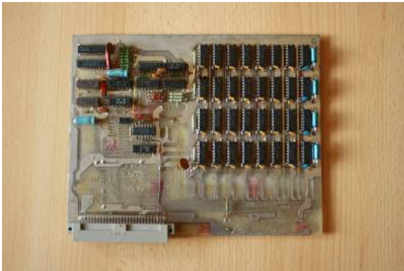
256K-RAM-Floppy (ohne zusätzlichen 64K Hauptspeicher)

Bilder s.a. http://www.robotrontechnik.de/html/computer/z1013_ausbau.htm