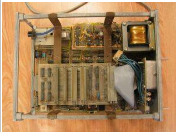
Und ein Blick von oben, ohne Gehäuse.