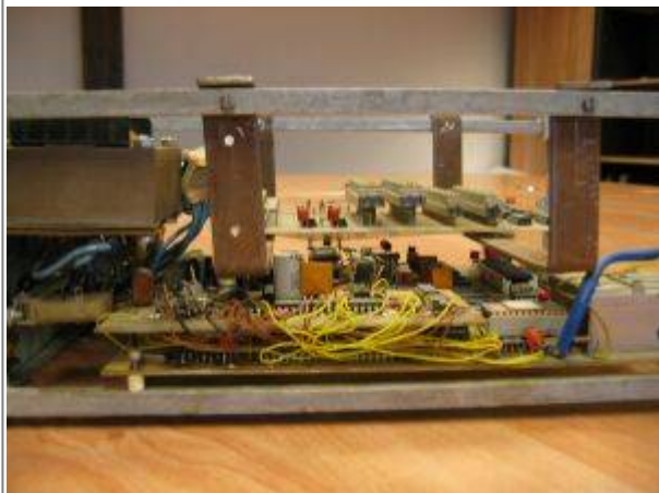
Hinten links befindet sich die Peters-Platine zur 64x16 Bildschirmumschaltung. Der Takt von 8 MHz wurde mangels Quarz mit einer RLC-Schaltung generiert. Wahnsinn, dass der ganze Kabelverhaue immer noch funktioniert!