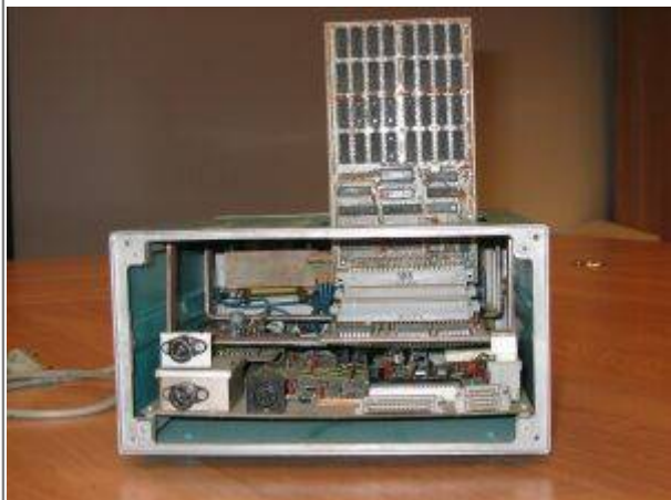
Ansicht von vorn. Zu sehen ist links der zusätzliche Videoausgang und rechts der Baugruppenträger, auf U-Winkel geschraubt.