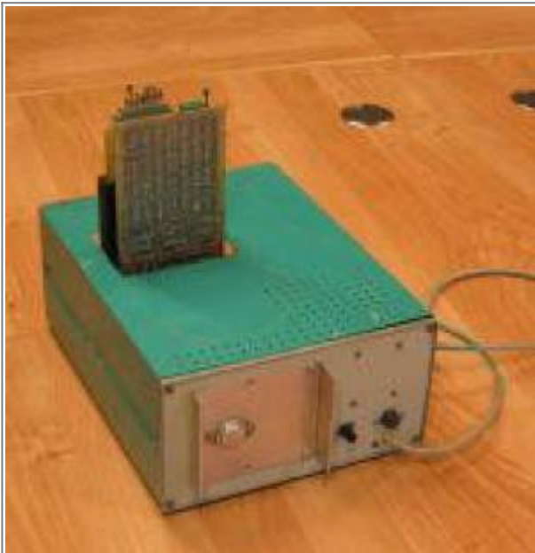
Der Z1013 von hinten mit aufgesteckter 256K-Nanos-RAM-Floppy und Eprommer .