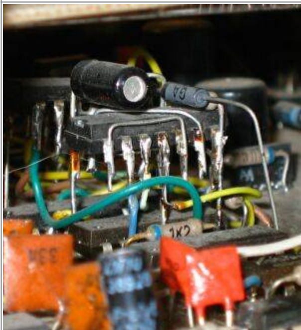
Das müsste die erweiterte Resetlogik ein, im üblichen Huckepackverfahren realisiert.