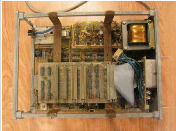
Und ein Blick von oben, ohne Gehäuse.

From: https://hc-ddr.hucki.net/wiki/ - Homecomputer DDR