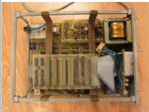
Und ein Blick von oben, ohne Gehäuse.