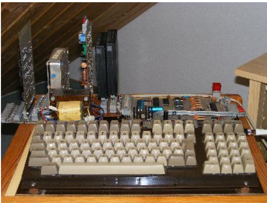
Bild des Z1013 mit der 6x16-Tastatur