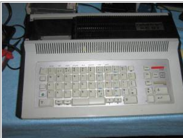
KC87 von Volker H. mit aufgesteckten Laptop-Tasten

Überraschenderweise konnte ich kurz vor der Abreise am Sonntag einen BIC erwerben! Damit steht der Anpassung des SD-Karten-Treibers an den BIC nichts mehr im Weg.