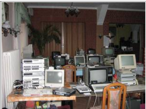
Samstag Morgen, vor dem großen Ansturm