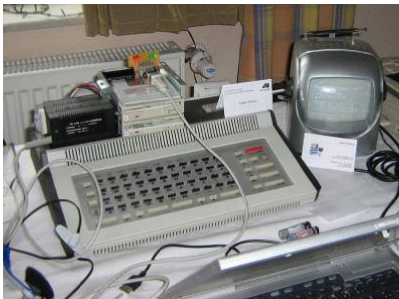
Mein kleiner Stand: Z9001 mit Spracheingabemodul, 2 Stück 3.5"-Diskettenlaufwerken und Miniatur-S/W-Fernseher.

Es gab auch in diesem Jahr reichlich Wissenswertes zu erfahren: so z.B. über den Umbau des KC85/3 auf doppelte Taktfrequenz und die dabei auftretenden Probleme nebst Lösungen von <unbekannt>; den Z9001 mit 80x24 Zeichen von Ulrich; Netzwerk und USB am KC85/3 (Obwohl ich letzteren Entwicklungen skeptisch gegenüber stehe, da Kosten und Technik den eigentlichen Rechner überragen, war die USB-Lösung von Mario die schnellste Variante, um Software vom Laptop auf eine BIC-Systemdiskette zu übertragen. Normalerweise mache ich sowas im Heimnetz mit einem alten 386er mit 5 1/4,-Laufwerk und SCOPY, aber solche Technik war beim Treffen nicht dabei.)