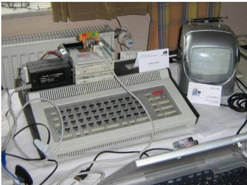
Mein kleiner Stand: Z9001 mit Spracheingabemodul, 2 Stück 3.5"-Diskettenlaufwerken und Miniatur-S/W-Fernseher.