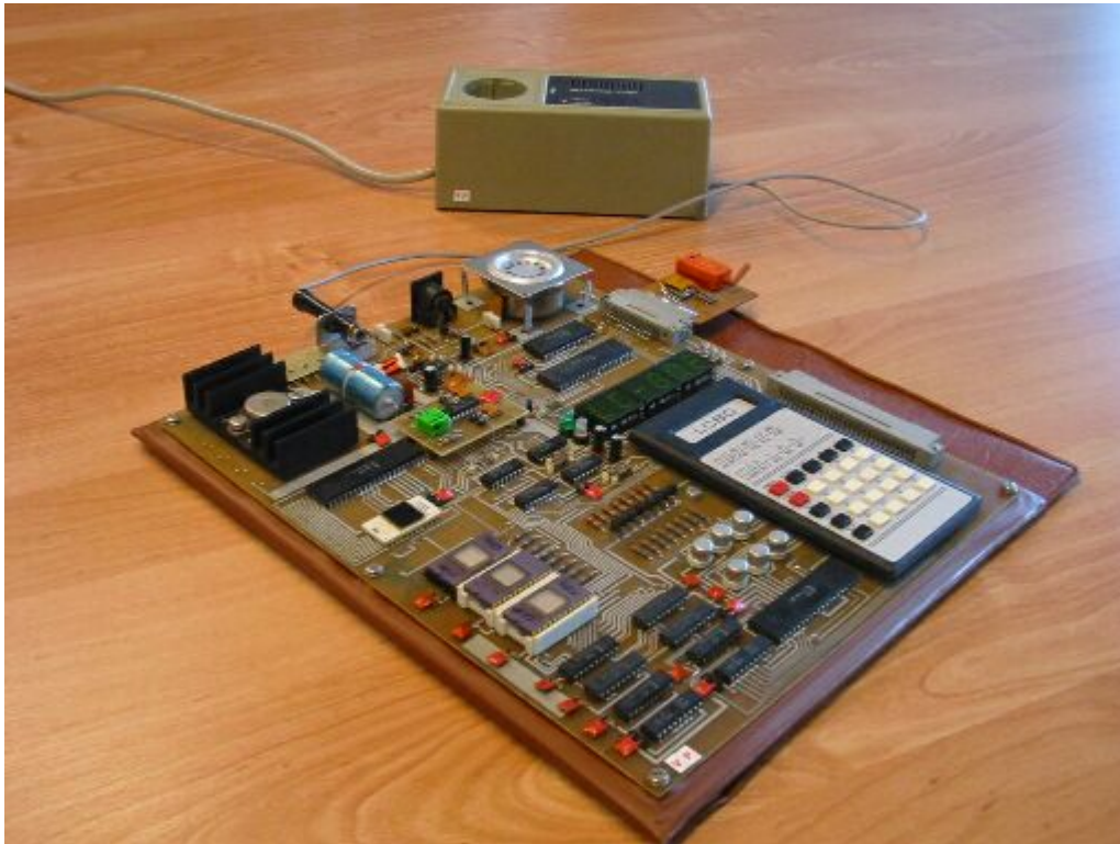
Mein LC 80 im Vollobau (orig. Netzteil, 4K RAM, alternatives Betriebssystem , IC-Tester

Der LC 80 (auch LC-80 oder LC80 geschrieben) war der erste in der DDR frei erhältliche Computer. Er gehört zur Kategorie der Lerncomputer der späten 70er Jahre, also zum Kennenlernen der Z80-Maschinencodeprogrammierung. Entwickelt und produziert wurde er im VEB Kombinat Mikroelektronik Erfurt (VEB Funkwerk Erfurt (FWE)?).