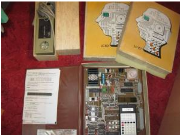
LC 80 mit innerer Abdeckung (rechts), Verpackung (Mitte sowie unter LC 80) und Netzteil nebst Verpackung