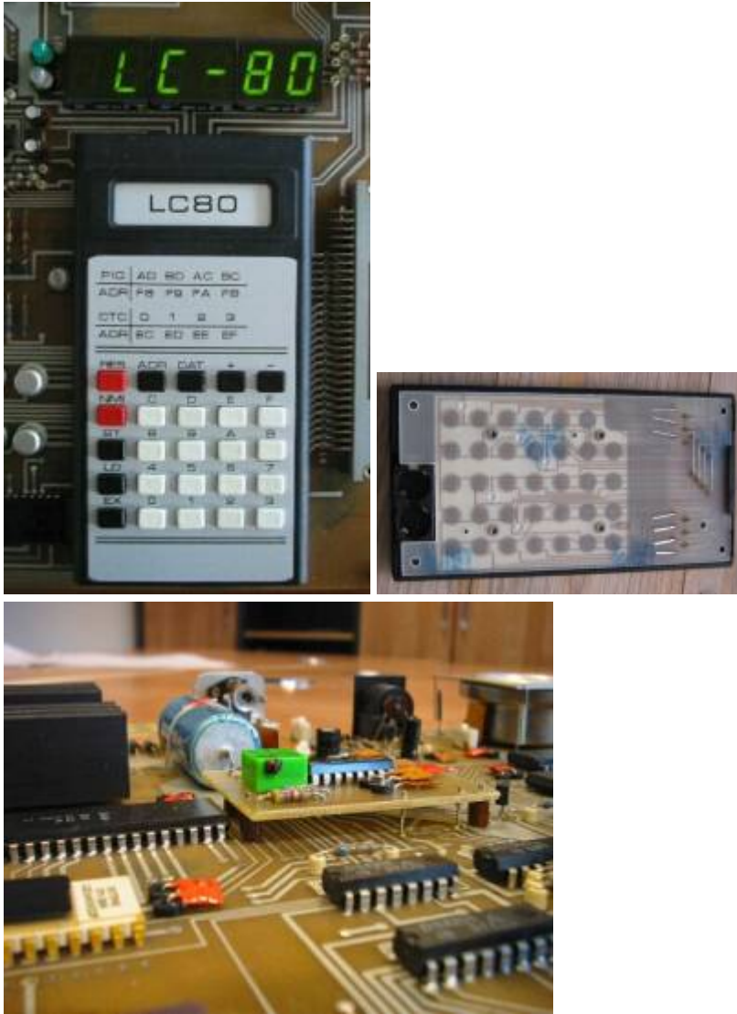
Tastatur und Anzeige, Tastatur Rückseite, geänderte Takterzeugung

Die Tastatur stammt vom Schulrechner SR1, s.a. Erinnerungen . Im mittleren Bild ist eine unverbaute originale LC 80-Tastatur abgebildet. Man erkennt deutlich die Knopfzellenfächer im Taschenrechnergehäuse. Rechts ist die geänderte Takterzeugung als Platinenaufsatz für die Leiterplatten der Version 3-1 zu sehen. Schaltbild s. schaltbilder .