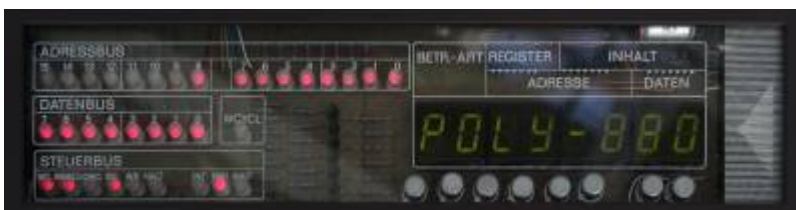
Display in Betrieb

Zum Polycomputer gehören 3 Handbücher: Bedienhandbuch (3 Teile), Systemhandbuch (2 Teile), Arbeitsbuch (1 Teil).