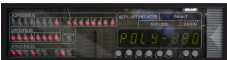
Display in Betrieb

Zum Polycomputer gehören 3 Handbücher: Bedienhandbuch (3 Teile), Systemhandbuch (2 Teile), Arbeitsbuch (1 Teil).