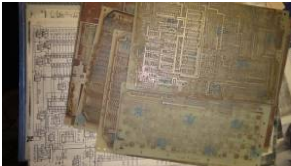
Original-Leiterplatten und -Dokumentation