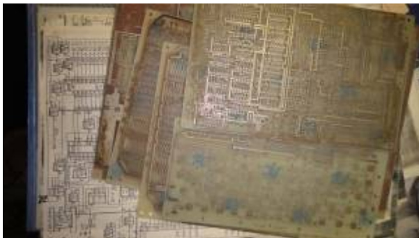
Original-Leiterplatten und -Dokumentation