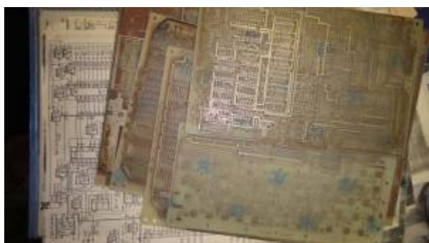
Original-Leiterplatten und -Dokumentation