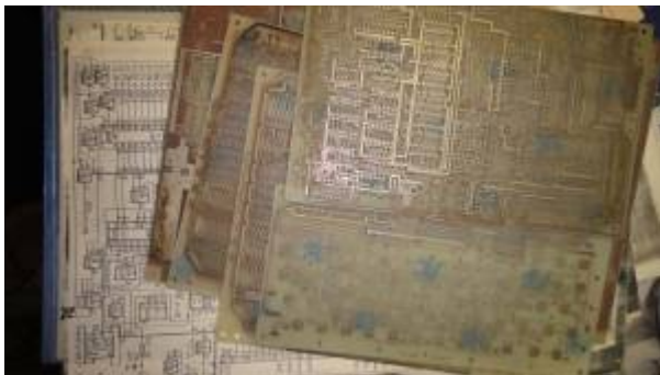
Original-Leiterplatten und -Dokumentation