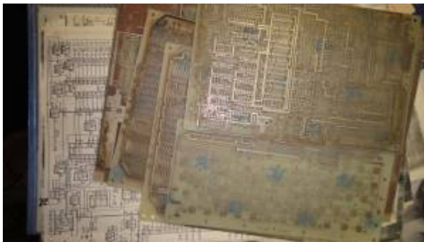
Original-Leiterplatten und -Dokumentation