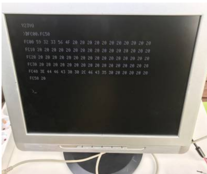
Bildschirmanzeige (B. Fuhrmann).

Buch und originaler MC von OM Kramer Y23VO, erweitert um Floppy und Vollgrafik (aus FA 3/88, III US)