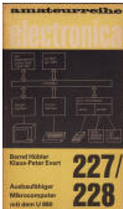
Systemübersicht, electronica 227/228

Im Download-Paket sind die Monitorbeschreibung, der Zeichensatz, und der Quelltext des Monitorprogramms (abgescannt, Code und Assembler getrennt geprüft und verglichen, sollte also 100% i.O. sein) enthalten.