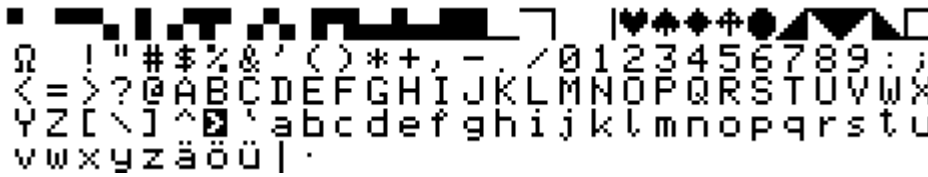
Zeichensatz Version 3.2 (F.P.)