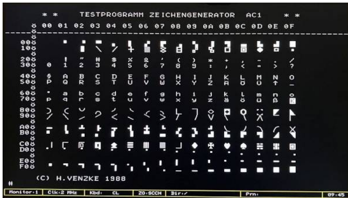
Zeichensatz SCCH mit Umlauten