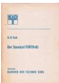
FIG-Forth für den KC 85/3, s.a. Messdat

Vack, Gert Ulrich: Der Standard Forth-83. Eine deutsche Beschreibung des Standards.