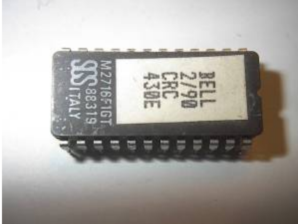
orig. EPROM der erweiterten Software