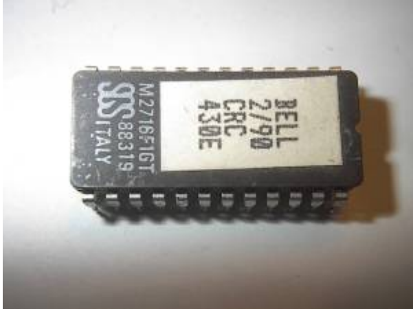
orig. EPROM der erweiterten Software