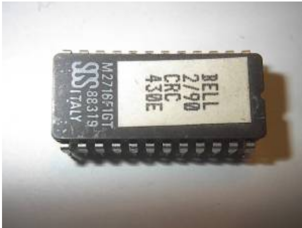
orig. EPROM der erweiterten Software