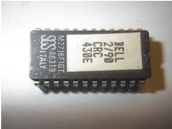
orig. EPROM der erweiterten Software