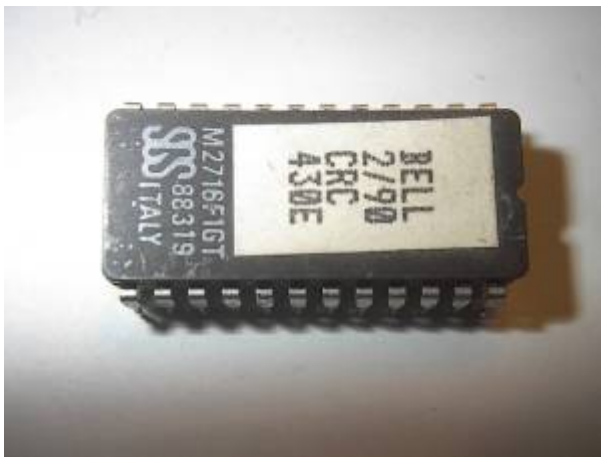
orig. EPROM der erweiterten Software