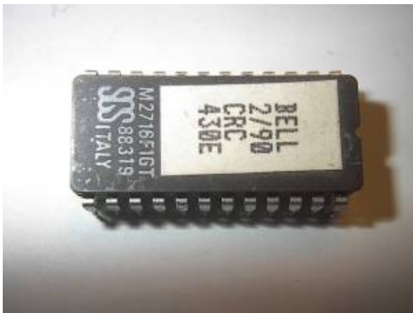
orig. EPROM der erweiterten Software