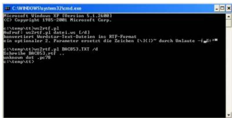
Aufruf des Tools

originale Datei mit den bekannten DOT-Kommandos und den Buchstaben mit gesetztem 7. Bit am Wordende.