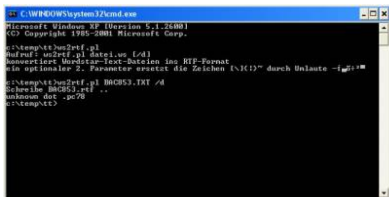
Aufruf des Tools

originale Datei mit den bekannten DOT-Kommandos und den Buchstaben mit gesetztem 7. Bit am Wordende.