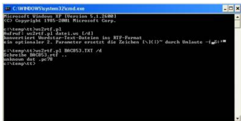
Aufruf des Tools

originale Datei mit den bekannten DOT-Kommandos und den Buchstaben mit gesetztem 7. Bit am Wordende.