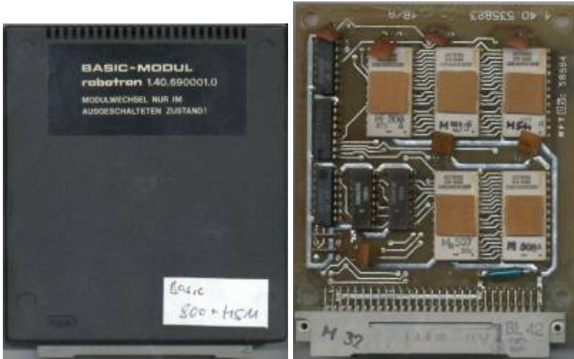
Alte ROM-Leiterplatte (Typ A)

Basic-Modul 86: ROM BM600 und EPROM M511